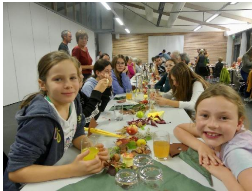
Sonntagmorgen beim Klausenhof